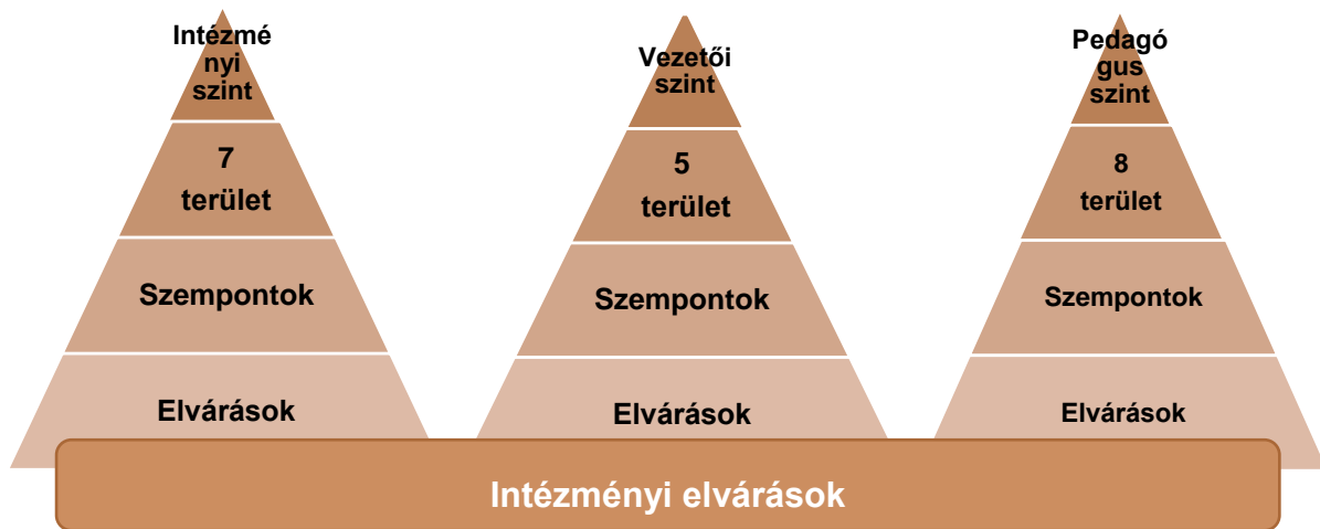
3. sz. ábra. A standard elvárásainak és az intézményi elvárások viszonya