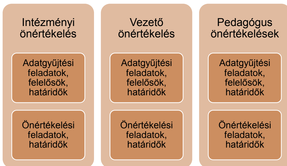
5. sz. ábra. Az éves önértékelési terv ajánlott szerkezete

Az éves önértékelési tervben szereplő határidőket, felelősöket az intézményvezető vagy a nevelőtestület erre kijelölt tagja rögzíti az Oktatási Hivatal által működtetett informatikai felületen, amely a tervben rögzítettnek megfelelően teszi elérhetővé az adatgyűjtő és az értékelő funkciókat az értékelésben részt vevők számára.